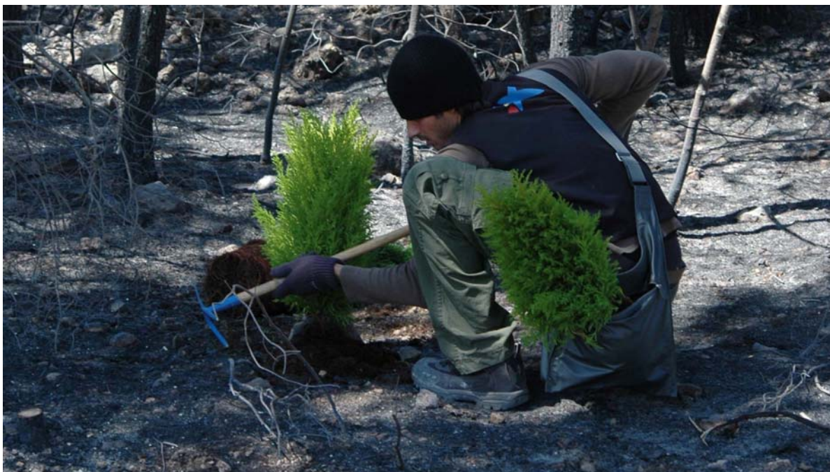
Personas en riesgo de exclusión social trabajan la restauración de hábitats de gran valor ecológico